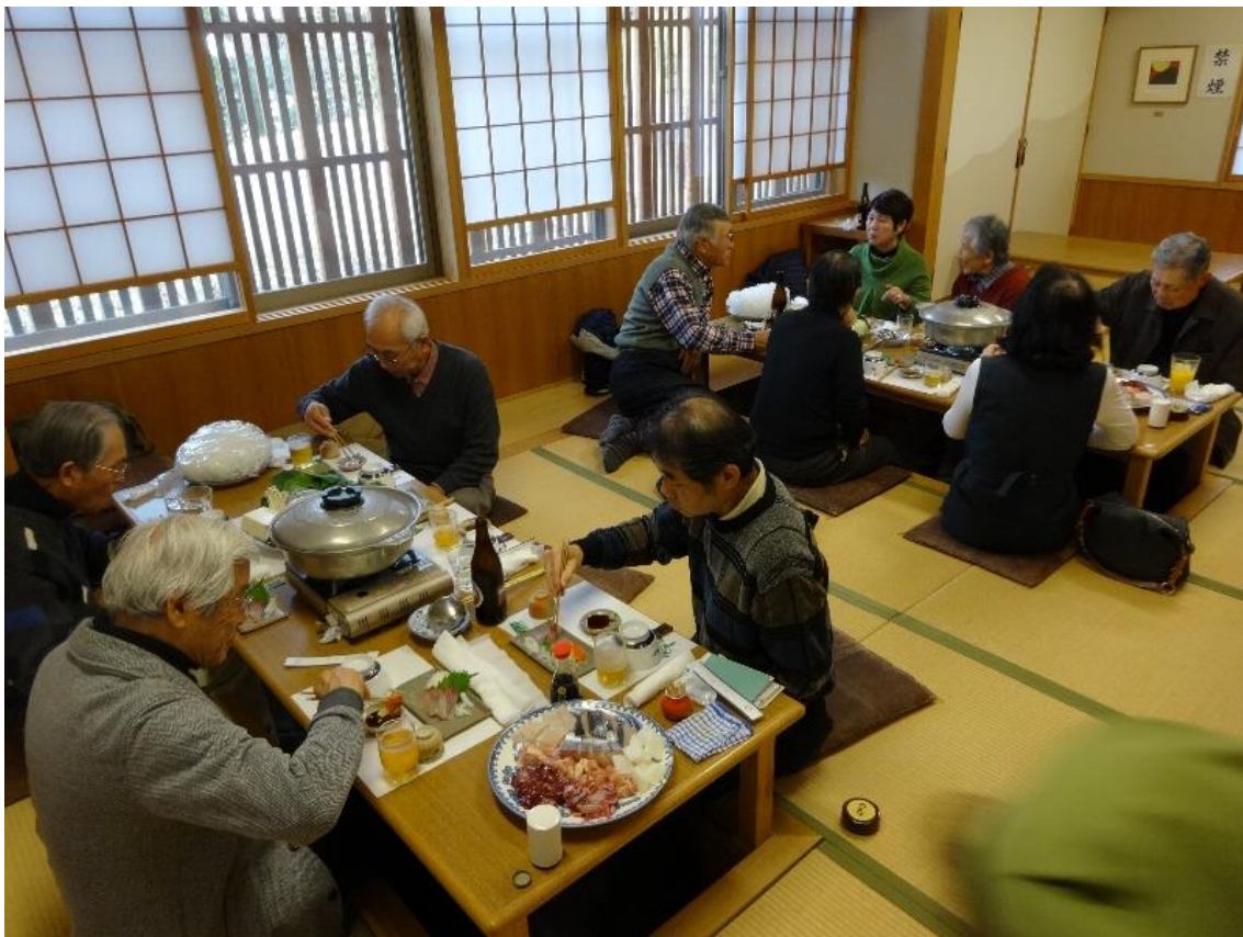
黙々と食べる人たち

平成 29 年「行こう会」の新しい候補地も複数案出てきました。順次ご案内して行きたいと思います。本年も「行こう会」をよろしく願いいたします。