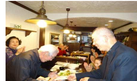
投票・表彰式・集合写真